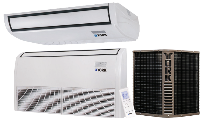
Piso Techo - YNFFZC (24-60) - Sólo Frío

La condensadora (unidad externa) y evaporadora (unidad interna) están diseñadas para un funcionamiento silencioso.