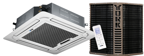
Cassette YNKFZC (24-60) - Sólo Frío